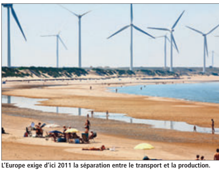
L'Europe exige d'ici 2011 la séparation entre le transport et la production.

ment d'une offre à 39 euros l'action, cette stratégie n'inquiète pas outre mesure. «Il n'y a rien de vraiment neuf. Au moment de l'acquisition, nous savions que cette stratégie allait être mise en place un jour ou l'autre. La Commission européenne oblige d'ici 2011 le secteur à séparer ses activités production et