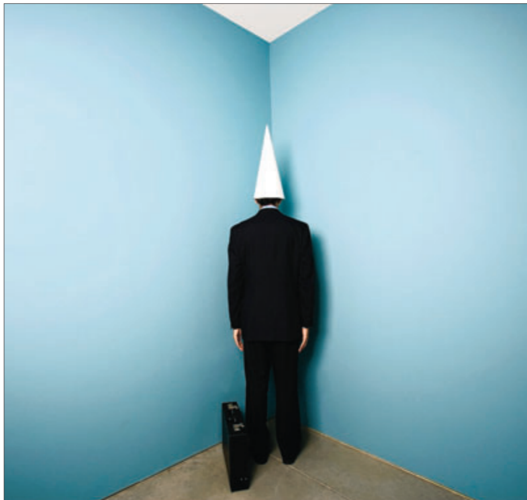
Si la plupart des PME cotées sur le Marché libre font de louables efforts pour communiquer leurs résultats annuels, on en recense encore qui répugnent à mettre cette information élémentaire à la disposition de leurs actionnaires.

Quelle serait la situation idéale? Toute PME cotée devrait non seulement informer la presse, mais aussi mettre sur son site internet et celui d'Euronext le rapport annuel - en ce compris les comptes ou au moins les chiffres-clé - à la disposition des investisseurs. Cette opération devrait intervenir dès que possible, et en tout cas avant la fin du premier semestre. Or, on constate par exemple qu'à ce jour, Oxbridge n'a même pas pris la