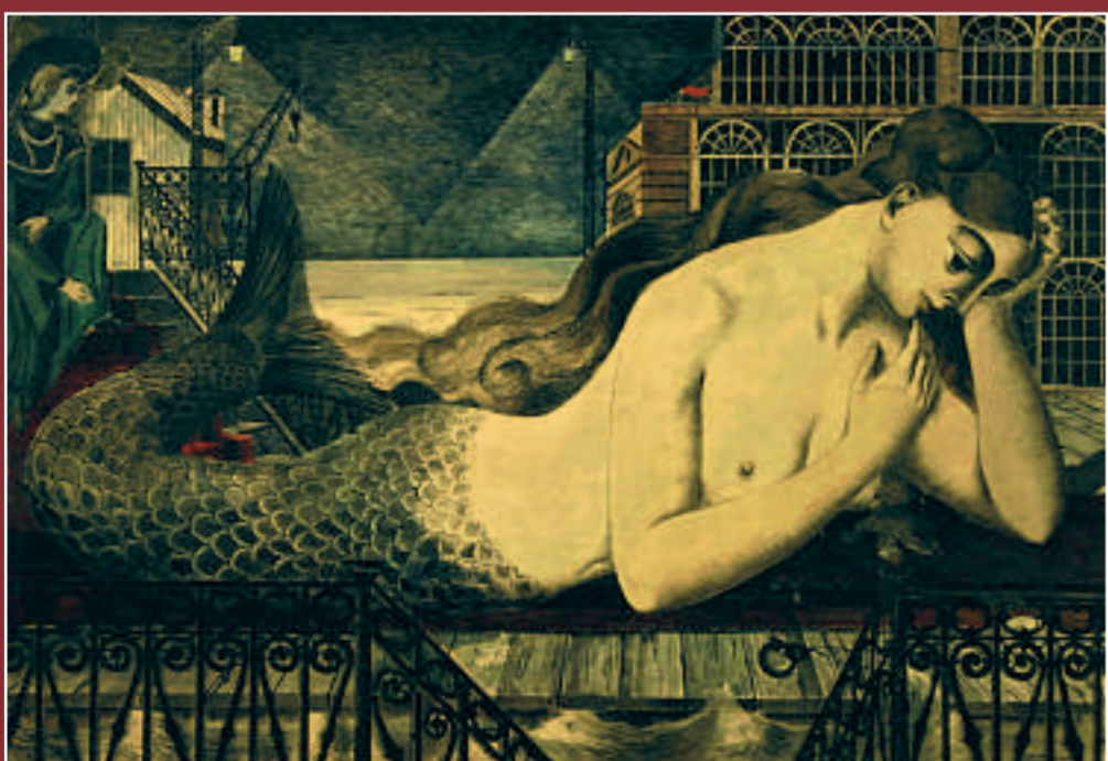
Paul DELVAUX - "La grande sirène" - signé - 1950

DELVAUX - ENSOR - VAN RYSELBERGHE CLAUS - DE SAEDELEER - MINNE DE SMET - PERMEKE - VAN den BERGHE